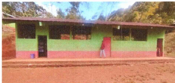
Foto 4: Observacion del techo con necesidad de sustitucion del modulo 1, 2 y direccion.