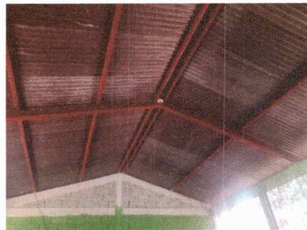
Foto 2: Las costaneras de metal con necesidad de aplicación de pintura.