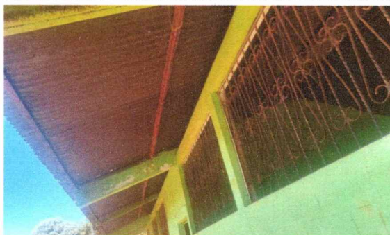
Foto 3: En esta foto se observan que las ventanas no cuentan con marco ni mucho menos vidrios