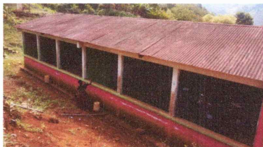
Foto1: Se observa que las laminas del techo, estan totalmente deterioradas, con agujeros.